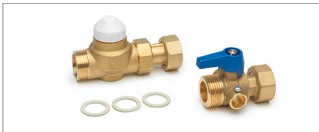
Obr. 125 HKV-regulační ventil - sada