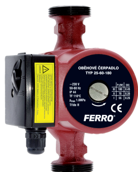
W0202 Oběhová čerpadla FERRO pro pitnou vodu